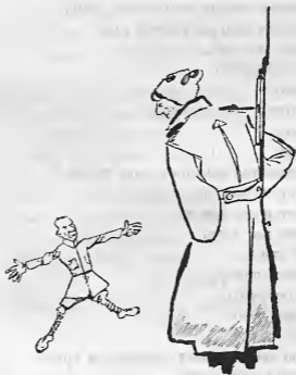
Рис. К. Ротова.